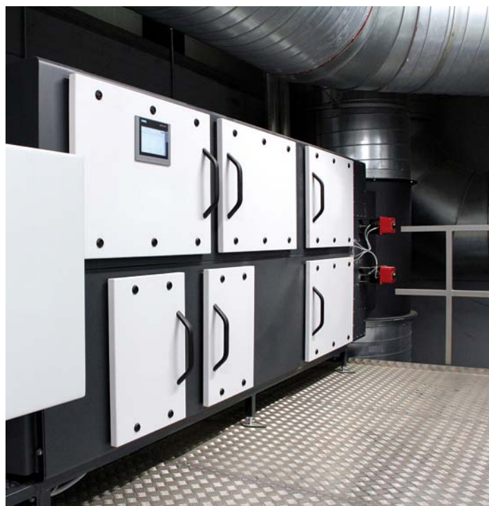
Abb. 2: Beispiel einer installierten „Coplas clean“-Anlage zur Behandlung einer Abluft-Durchsatzmenge von 30000 m 3 /h

Wir sind froh, dass wir unseren Kunden mit der neuen Technologie all diese Vorteile bieten können. „Coplas clean“ ist das aktuell fortschrittlichste Kaltplasma-System auf dem Markt.