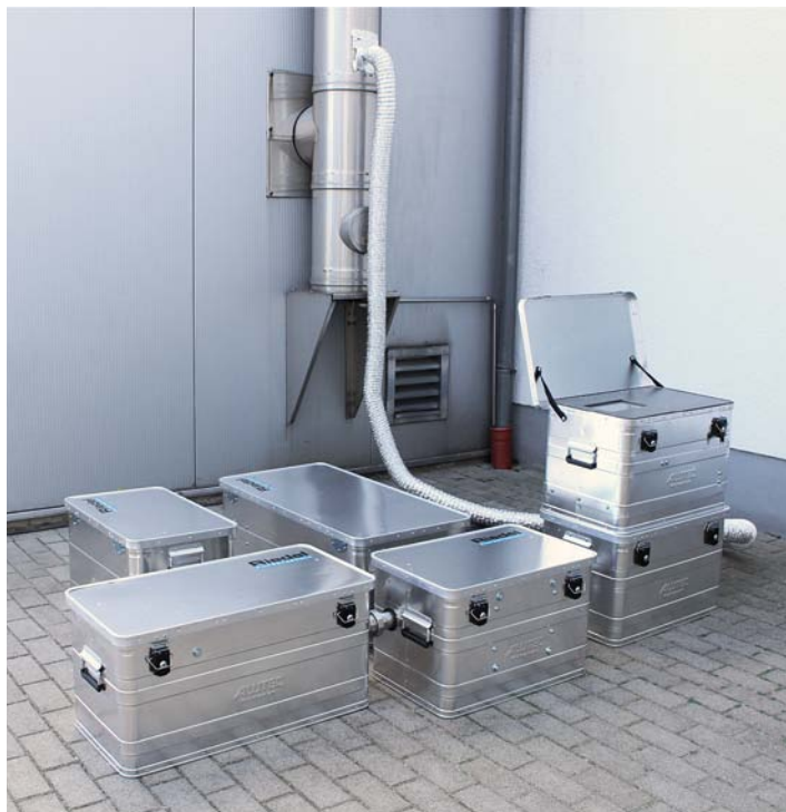
Abb. 3: „Coplas clean Mobile Unit“ für das Customizing beim Kunden vor Ort

Reingasproben wird die Reduzierungsleistung bestimmt und schließlich die erforderliche Energie des Gesamtsystems festgelegt.